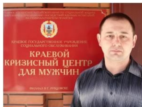
«Да, я вас внимательно слушаю,