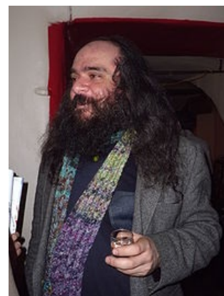
Псой — образцово-сферический ЕРЖ , Антисвиборг .

Широким же массам этой страны он известен как исполнитель акустического техно « Буратино был тупой », а также трёхминутного рифмованного потока-перечисления реалий этой самой страны « Остров ,