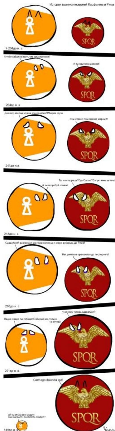
Краткое содержание статьи

Тем временем на Сардинии наёмники также восстали всё по той же причине. Они перебили карфагенян, но понимали, что вскоре их ждёт анальная кара. Рим, естественно, послал их лесом , ибо не комильфо. И