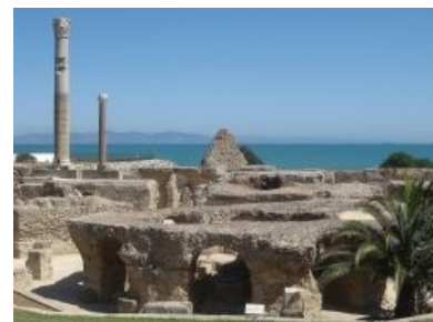
Руины римского Карфагена

Римляне постарались стереть любые упоминания о том, что когда-то существовала империя пунов, поэтому уничтожили не только сам город, но и предметы искусства, храмовые принадлежности, сожгли все книги, из которых уцелел лишь трактат знаменитого карфагенского эксперта в области сельского хозяйства Магона. Эти трактаты были настолько продвинутые, что их штудировали даже в Средневековье! Поскольку потомки Ромула тоже были выходцами из аграриев , они фапали на всё, связанное с сельским хозяйством. Иначе бы труды Магона также пошли бы на растопку в одной из римских терм.