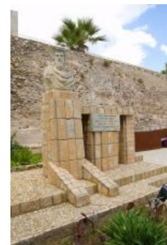
Памятник Гасдрубалу в Картахене