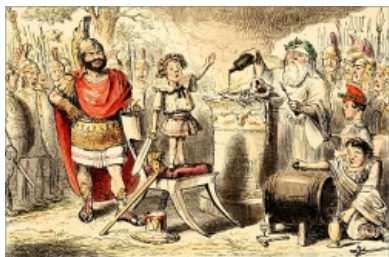
Клятва Ганнибала, карикатура Джона Лича

сына Ганнибала. Как гласит легенда, Ганнибал всегда испытывал ненависть к Риму, потому что перед походом, будучи ещё малолетним долбоёбом, произнес перед алтарем клятву всегда ненавидеть Рим и бороться с ним. И до конца своей жизни Ганнибал пытался обосрать малину римлянам.