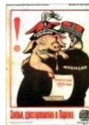
Поросёнок Юзеф (Пилсудский)