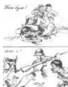
А ну-ка, давай-ка, уёбывай отсюда...