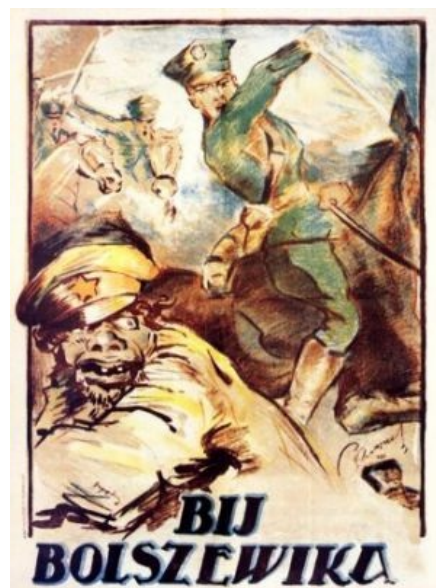
Поляки обижают русского человека во времена Пилсудского.

Польский взгляд на альтернативную историю: Польша, оказывается, вполне могла бы наkostenять Гитлеру и Сталину, заключив союз с Японией.