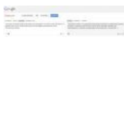
гугловерсия на польском