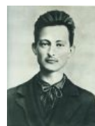
Железный Феликс (тоже поляк) ещё не обрел фирменные wąsy i broda , но уже смотрит на соплеменников должным образом. (спойлер: Да и на несоплеменников тоже.)