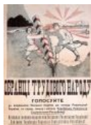
Задабривание бандерлогов — два.