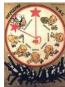
Ваше время истекает...