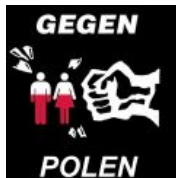
На Краутчане поляков тоже любят