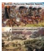
Шляхетский гонор во всей красе.