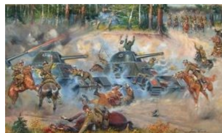
Знаменитая атака в конном строю на танки. Геббельс одобряэ.