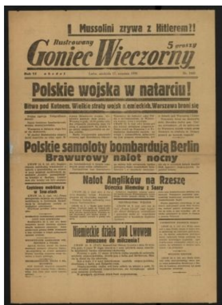
польская газета от 17 сентября 1939 года.

Заголовки: «Польские войска наступают!» «Муссолини порвал с Гитлером?!» «Польские самолёты бомбят Берлин» «Немецкую артиллерию под Львовом заставили замолчать!»