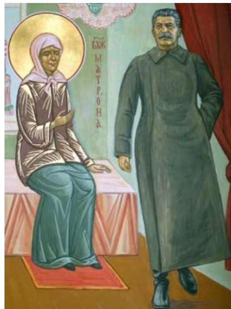
Святой Иосиф глазами ПГМ-сталинистов.