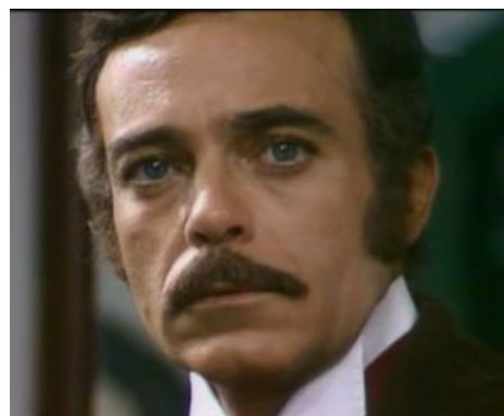
Леонсио смотрит на тебя, как на раба.

Рабыня Изаура. Собственно главная героиня. Вечно меланхоличная страдалница, причем настолько, что возникает искреннее желание устроить ей в целях излечения пробежку по живописному бразильскому ландшафту, подгоняя ритмичными пинками под музыку из сериала. Постоянно рыдает (начала пускать