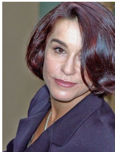
Сейчас рабыня уже не та... хотя кому как