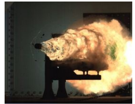
Сабж в действии на первой миллсекунде.

Вундервафля состоит из двух параллельных электродов, называемых рельсами. Разгоняемый снаряд также является проводником электричества и располагается между рельсами. Замыкая электрическую