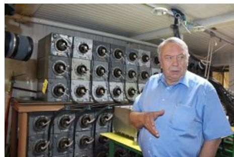
Советские конденсаторы для рельсотрона на фоне президента РАН

Несмотря на то что в sci-fi сабж активно форсится как кинетическое оружие будущего, он по сей день особо не востребован. Даже в широко разрекламированных американских «замволтах», которые под магнитотроны проектировались изначально, футуристические пукалки заменили на обычные, отправив на доработку. Дело в том, что для современного порохового оружия не существует проблем ни с мощностью выстрела, ни с герметичностью. Даже турель «Алмаза» — первая пушка, работавшая в космосе — заряжалась традиционными капсюльными снарядами. Таким образом, выстрел скорее разорвёт ствол, оторвёт башню или перевернёт броню, чем его мощности не хватит для любой наперёд поставленной задачи.