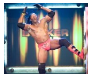
Wi commin' for u nigga