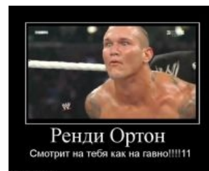
Ортон не уступает Свйборгу.

IRL в отличие от Сины, действительно служил в армии, просидел 38 дней в военной тюрьме за дезертирство и неподчинение приказам. Дизайн своих татуировок рисовал сам. Спалил Келли Келли, спизданув, что она переспала чуть ли не со всеми рестлерами и работниками WWE (ну кроме Хорнсвоггла наверное, но чем чёрт не шутит). Впрочем, можно совершенно обоснованно предположить,