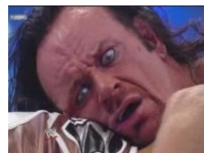
Гробовщик разочарован статьёй

До определённого момента имел беспроигрышную серию предельно ыпичных матчей на РестлМании (21:1), однако на юбилейной РМ был безбожно слит Борку Лазеру. Слит по своему желанию. За 4 часа до шоу, Винс изменил исход их боя. Макмен уже созрел в интервью Остину, что это он зря. Собственно, в последнее время он и возвращается на ринг только к очередной РестлМании — возраст, ничего не попишешь . Снялся в начале 90-х в фильме «Комmando из пригорода» в роли сурового инопланетного охотника за головами, где отгрёб от Халка Хогана. Сцена из фильма, где он произносит единственную фразу голосом человека, надышавшегося гелия, доставляла невероятно, ибо на момент выхода фильма эта фраза была вообще единственной сказанной им на экране, а до того он молчал на ринге и не давал ни одного интервью. К следующей РМ подкачался, помолодел и выиграл у Брэя Уайатта, успел ещё раз пофьюдить с Леснаром, объединиться с братцем Кейном и снова отоварить Уайатта, на сей раз уже вместе со всей его «семьёй». На Мании 32 показал сноооооосенький такой поединок в клетке с вернувшимся Шейном Макменом, в главном споте матча вовремя укатился с комментаторского стола и не подставился под ёбнувшего вместо Тейкера стол Шейна, прыгнувшего с 6-метровой в высоту крыши клетки. На 33 Мании был подложен под Ромку Рейнса и, судя по всему, похоронил персонажа Гробовщика, оставив от него на ринге лишь шляпу,