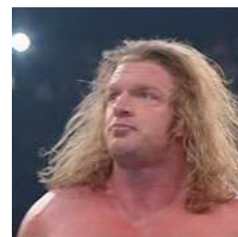
Вы смотрите на него как на говно