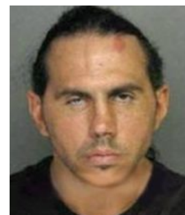
Мэтт Харди, алконавт едишн