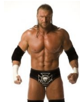
Он самый, смотрит на вас как на говно