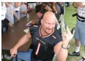
Fuck fear, got beer

Алсо , однажды не удержался и блеванул прямо в камеру, попутно зацепив стоящих рядом менеджеров и, в том числе, даже Эрика Бишоффа. Несмотря на всё это, толпой был невозбранно любим не меньше того же Стива Остина, от которого однажды сам отгрёб неиллюзорных. Спивался, чуть не отдал концы, однако из последнего запоя был вытащен Даймондом Далласом Пейджем и поставлен на ноги. В последнее время живёт со своим сыном Коди, начинающим рестлером, попутно являясь его менеджером и активно тренирует парня. Вместе колесят по стране и в Японии и участвуют в шоу. Не повелись на бабло и отказались от контракта с WWE, сказав что Коди перейдёт в компанию, только когда посчитает себя готовым. Респект мужикам. На виду до сих пор, хотя уже не торт — посмотрите хотя бы на его оплывшую харю или подсчитайте количество неудачных геройств. Дети, алкоголизм — зло! Неу Yo.