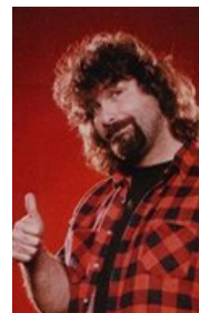
Мне 34, и я — инвалид