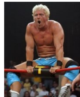
Джарретт после просмотра iMPACT