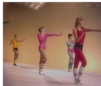
Опять он, уже не шифруется