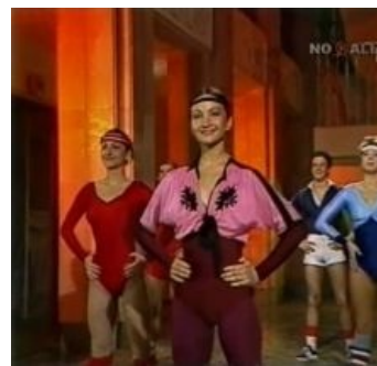
Видишь, вон он, затесался сзади

Те люди , кому сейчас от 27 и старше , ритмическую гимнастику не забыли. Google на запрос «ритмическая гимнастика 80-х скачать» выдает примерно 12 600 результатов. Отдельные представительницы прекрасного пола до сих пор занимаются по заученным с детства упражнениям, утверждая, что ничего лучше советской ритмики не придумали и никакие пилатесы, шейпинги и прочие степы с ней не сравнятся. Сильная же половина нет-нет да и вспомнит свои