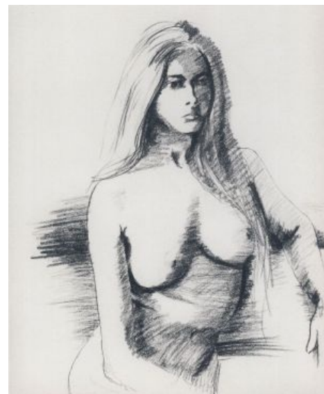
ЧСХ, художественное творчество Фейнмана чуть более, чем наполовину состоит из портретов голых баб