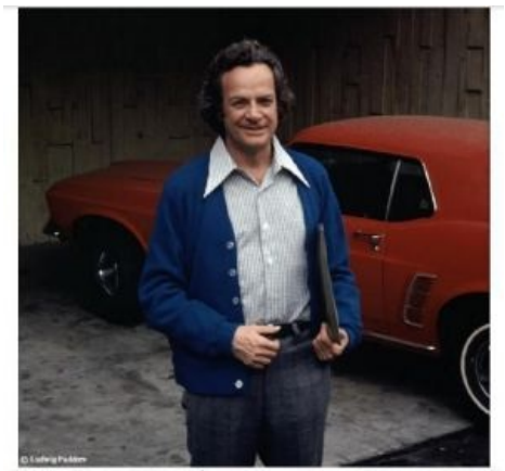
Фото: Ричард Фейнман 4 на фоне своей красной машины (1972 г.).

Уже потом, став художником, Фейнман в свободное от