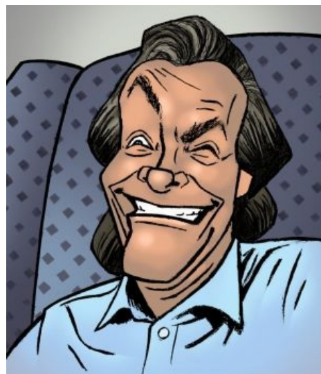
Карикатура на сабж. Чем не Trollface?

Снова возвращаюсь к первому шкафу и набираю 27-18-28 — ЩЕЛК! Сработало! (Основание натуральных логарифмов 2,71828 — вторая по важности после пи математическая константа.) Шкафов девять, я открыл первый, но нужной бумаги в нем не было — бумаги шли в алфавитном порядке фамилий авторов. Пробую второй шкаф: 27-18-28 — ЩЕЛК! Открылся той же комбинацией. «Чудесно, — думаю я, — я открыл все секреты атомной бомбы, но если я собираюсь когда-нибудь рассказывать этот анекдот, я должен убедиться, что все комбинации действительно одинаковы!» Некоторые из шкафов были в соседней комнате, я попробовал 27-18-28 на одном из них, и он открылся. Теперь я открыл три сейфа — и все три одной комбинацией.