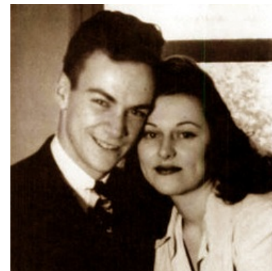
Фейнман с первой женой Арлин (спойлер: она умрёт)

Я пошел в то место, где распределялись комнаты, и мне сказали, что можно прямо сейчас выбрать себе комнату, и знаете, что я сделал? Я высмотрел, где находится общежитие девушек, и выбрал комнату прямо напротив — хотя позднее я обнаружил, что прямо под окном этой комнаты растет большое дерево .