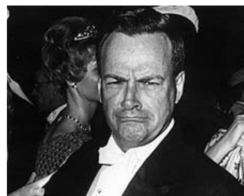
Фейнман негодуэ на собственное рукожопие

После войны я каждое лето путешествовал на машине где-нибудь по Соединенным Штатам. В один год, после того как я побывал в Калтехе, я подумал: «Вместо того чтобы отправиться в другое место, я отправлюсь в другую область». А это было сразу после открытия Уотсоном и Криком спирали ДНК.