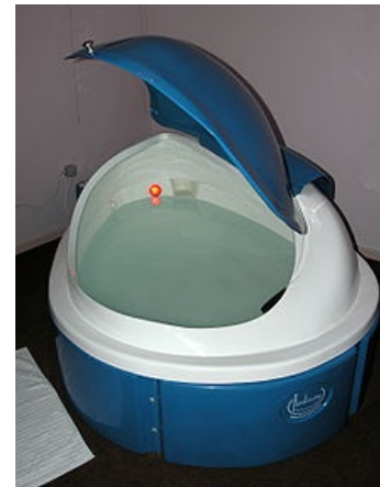
Современный потомок ванны, в которой плескался Фейнман

Физик признавался, что всегда любил побывать в изменённом состоянии сознания , но злоупотреблять веществами боялся, чтобы не повредить кормящий его гениальный мозг. В итоге он нашёл компромиссное решение — принять участие в эксперименте по сенсорной депривации, которые тогда были внове. Суть такова: человека помещают в закрытую ванну с звукоизоляцией в полной темноте, в воду добавляют соли, чтобы человек свободно держался на поверхности и не пошёл ко дну, к тому же температура воды совпадает с температурой тела. При полном отсутствии внешних раздражителей мозг пациента охуевает и начинает генерировать всяческие дулды, приводящие к ярким галлюцинациям и прочим маленьким радостям ЛСДшников .