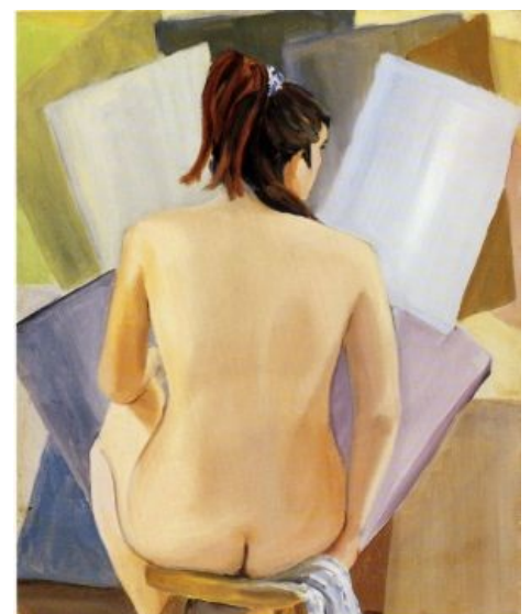
Пример творчества Фейнмана

Фейнман доставляюще описал случай с владельцем массажного VIP-кабинета, который хотел, чтобы он нарисовал для него символизирующую картину на стену, но не настолько символизирующую, чтобы полиция сходу просекла, что это не простое заведение, а с блэджком и шлюхами . В итоге Фейнман изобразил BDSM -сцену с рабыней в Древнем Риме. Но пока он писал картину, лавочку прикрыли, а заказчик уехал кататься на пативэне. Фейнман долго не мог найти покупателя на свой BDSM -шедевр, пока кто-то из друзей не посоветовал ему умножить цену картины на три. Он так и сделал. Картину купили на следующий же день. Потреблядская логика налицо.