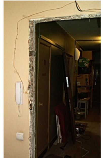
Дверь мне запили, блеать!

И когда им кажется, что они поймали меня, я напоминаю им: «Но вы сказали апельсин! А апельсиновую кожуру невозможно разрезать на кусочки тоньше атомов».