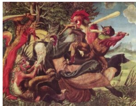
Краткое содержание книги

В основе учения Розы мира три основные идеи, две из которых — постулат. Первая идея о двойственности мира, пронизанного влиянием мира горнего и мира демонического, на стыке которых мы живем. Вторая идея о том, что над нами находятся миры и миры, и мы лишь один из миллиона и миллиона миров, и Иисус Христос — всего лишь наш, планетарный Бог. И третья и самая главная идея — идея Розы — каждый из лепестков которой является одной из религий правой руки: христианство , буддизм , иудаизм , индуизм, ислам . А вместе это новая религия человечества, которая возьмет в себя все лучшее из всех религий посредством тщательного отбора и воцарится на Земле до прихода Аццкого сотоны, который будет реинкарнацией угадайте кого .