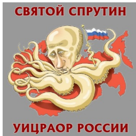
Кто бы мог подумать?