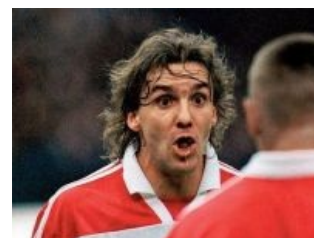
Пас мне запили! Быстро, блядь!!!

Uran - Kirkorov.Сергей Юран отжигает Барсик негодует