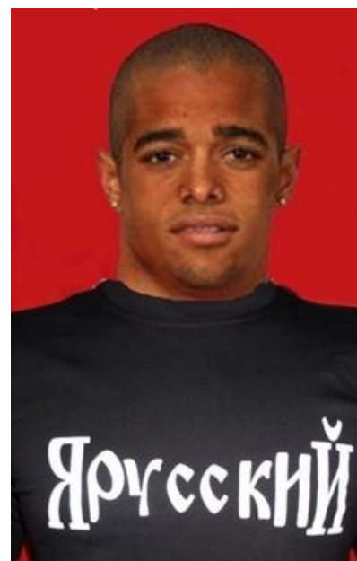
Увидел бона в майке...