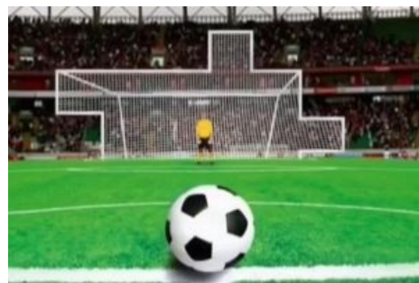
Кержакову нужны такие ворота

Нападающий сборной России Александр Кержаков в очередной раз поразил ворота. Ворота были искренне поражены тем, что в них можно не попасть с пары метров.