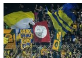
Приём Роберто Карлоса в Ростове

Болельщики ЦСКА снова вывесили расистский баннер