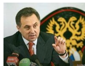
У Мутко маленький...