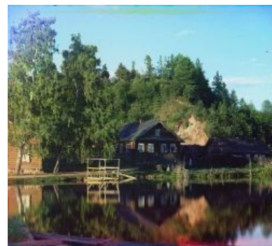
Трава была зеленее, вода была голубее.