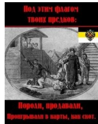
Салтычиха лютует под флагом