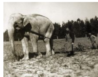
Слоны помогают сельчанам