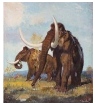
РОССИЯ - РОДИНА СЛОНА!

Американцы издали иллюстрированную брошюру «Всё о слонах». Французы — томик «Любовные игры слонов». Немцы — «Введение в изучение некоторых вопросов слоноведения» в десяти томах. Евреи — «Слоны и еврейский вопрос». В Советском Союзе издали трёхтомник: «Классики марксизма-ленинизма о слонах», «СССР — родина слонов» и «Слоны в свете решений XXVI съезда КПСС». В Болгарии вышел перевод советского издания, и дополнительный том — «Болгарский слон — младший брат советского слона». Монголия издала брошюру «Монгольский слон — 16-й слон в советском зоопарке».