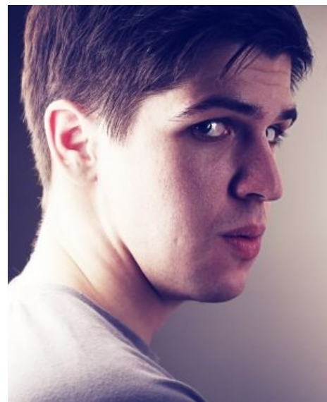
Усачев без грима и фотопшопа. Feel the difference

Полицейские Будни / 1 эпизод, 1 сезон 1 серия Полицейские Будни / 2 эпизод, 1 сезон 2 серия Полицейские Будни / 3 эпизод, 1 сезон 3 серия Сташевский + Пучков (Никель и Мэддисон) Неофициальное продолжение