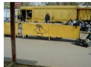
Сферический блошиный рынок в вакууме

Данный вид рынка любим определенными представителями небыдла за то, что иногда в продаже периодически попадают всякие такие раритеты, вероятность купить которые в другом месте крайне мала . К примеру фирменные японские LaserDisk-проигрыватели, а то и вообще аналогичный советский раритет, или полный комплект стереосистемы от Sony (усилок, эквалайзер, кассетная дека, тюнер, CD-плеер и вертушка винила); патефоны, а то и граммофоны, и пластинки к ним, ещё Сталина издававшие, а то и царя ; древние сотовые, искомые коллекционерами и всякими телевизионщиками, если те задумали снять сериал про 90-е. И всё очень дёшево. Хотя последнее время продавцы цены подняли в три-четыре