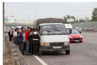
Рынок на Ярославском ш. за МКАДом

Появился сравнительно недавно , сначала в виде коротких объявлений: «Таджики. 8 (960) XXX-XX-XX». Позже к теме подключились «прорабы», у которых можно было купить хороших, годных таджиков для хозяйственных целей, примерно от 1000 руб в день. Оптом (например на стройку) — дешевле. Постоянным клиентам — скидки. У них также можно было решить вопросы крышевания нелегально понаехавших и кормления рабсилы халяльной (но, конечно же, просроченной! ) няжкой. В последнее время, в связи с некоторым кризисом и переизбытком предложения, стали стихийно формироваться рынки, на которых гастарбайтеры продают сами себя.