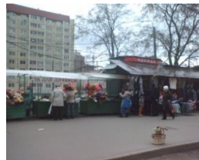
Примерно такой рынок есть в каждом городе

Обычно делится на две части: в одной идет торговля скоропортящимися продуктами: овощами, фруктами, мясом, а в другой — продуктами с относительно большим сроком хранения. Кроме продуктов иногда можно встретить в небольших количествах бытовую химию, шмотки и мелкую электронику. Чуть менее, чем полностью оккупирован гастарбайтерами . На сегодняшний день — вымирающий вид, так как не выдерживает конкуренции с гипермаркетами, где цены на продукты примерно те же, но, по старательно насаждаемому среди основной клиентуры мнению, меньше риска наткнуться на низкокачественный или просроченный товар. На самом деле в магазинах с качеством все точно так же, но зато тебе потихому не насыут тухлого говна из-под прилавка. Алсо, наепка при взвешивании давно стала фирменной рыночной фицей. Зато на рынке можно невозбранно торговаться . Так, например, на многих рынках солнечного Чуркестана торговец ломит большую цену сразу, ибо по дефолту предполагается, что Анонимус должен торговаться. Сам процесс доставляет обеим сторонам, служит неиссякаемым источником лузвов, прибауток и поговорок. Если Анонимус хорошо и оригинально торгуется, то помимо низкой цены получает бонус от торговца. Алсо, среди продуктов встречаются как и годные к употреблению вещи, так и мясо с финами бычьего и свиного цепней , и прочие радости. Вас предупреждали: доверяй, но проверяй.