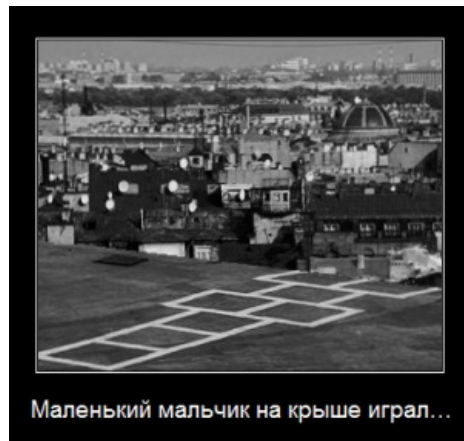
Маленький мальчик на крыше играл...

Стишки ни в коем случае не поучают, как правильно обращаться с бетономешалками и невзорвавшимися