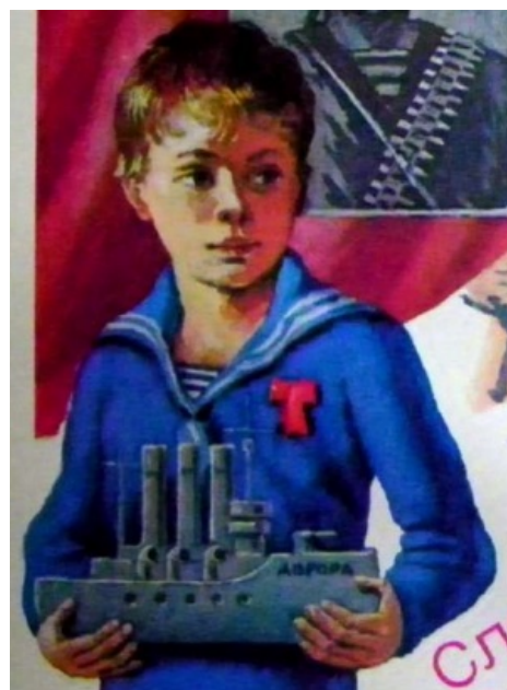
Загадочен, как Мона Лиза.

«Девочка к папе на стройку пришла, Девочка папе обед принесла. Под шлакодавкой увидел отец Пару косичек и платья конец »