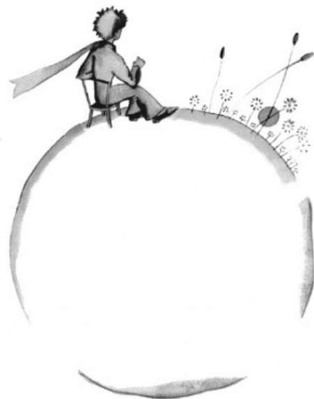
Околосферический маленький мальчик в вакууме. Или не в вакууме, шарфик-то, гляди, развевается!