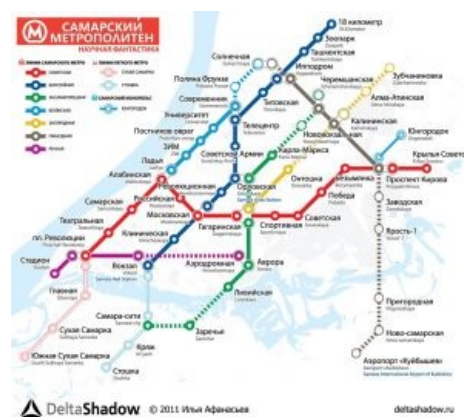
Метро, которое мы потеряли.