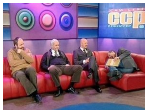
Вот такой он, сам себе режиссер

Ну и всё прочее в этом же духе. Каждый видеофрагмент сопровождается остроумными закадровыми комментариями (изредка, таки да, зело доставляющими). Между блоками выступал сам ведущий, который кагбэ в общем обрисовывал суть следующего блока. И тогда, и теперь эти его выступления остаются более чем унылыми. Вообще, ведущий сам по себе уныл, но всем это как-то похуй.