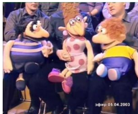
Те самые куклы

Окончательно добила сабж появившаяся в середине-конце 00-х возможность смотреть бугагашечки в Интернете, и с тех пор программу стали смотреть только самые упоротые ССР-фаги, всем же остальным даже не было известно, когда она выходила и выходила ли вообще. А транслировалась она в воскресенье рано утром, а в последний год существования и вовсе в 4:40, что буквально кричало о рейтинге передачи.