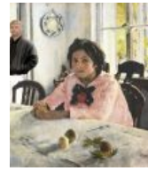
Девочка со свидетелем