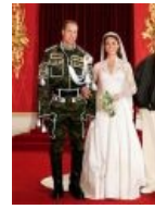
Был на королевской свадьбе