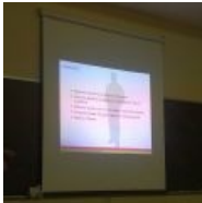
witness(4) в FreeBSD