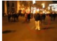
Таки засветился и на Евромайдане