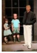
The hands resist him