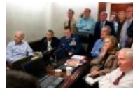
Как убивали Осю, он тоже видел...