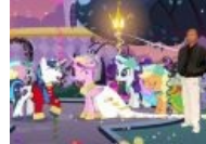
И на свадьбе пони