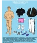
Игра «Одень Свидетеля»