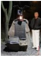
Свидетель побывал в Бресте