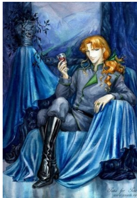
Яойный Зойсайт жоен