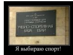
Я выбираю спорт!