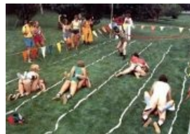
Забег по ебле на траве