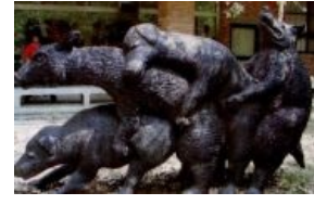
Памятник трахающимся волкам