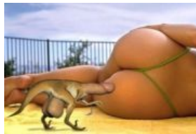
Какбэ охота на слона...