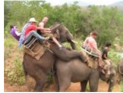
Секс у слоников