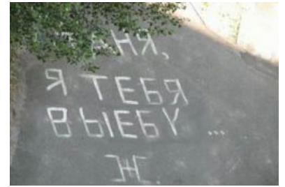
Мужик сказал — мужик сделает!