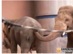
Фистинг у слоников