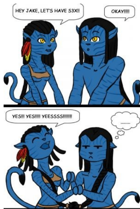
Секс на Пандоре