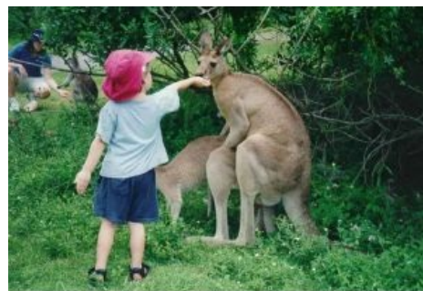
Зато в Австралии отдых дешевле и мясо вкуснее