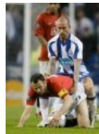
Ахтунг-футбол, серия пенальти