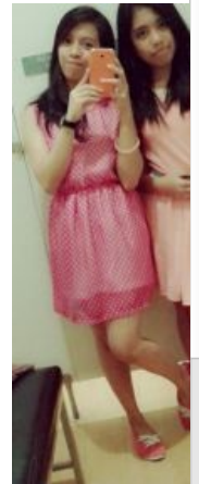
Филиппинские няши; для нормалов и к ним приравненных.