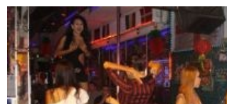
На его месте можешь быть ты, анон