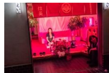
Типичный прилавок с поштучным товаром