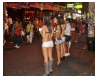
Морковь на Волке (засывает)

И если разговора о деньгах не было, это не значит, что вам дали за так. Не позорьтесь, дайте даме сувенир в 20$.