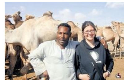
Стадо верблюдов — калым за белую женщину

У западных женщин в особом почёте Карибы, Ямайка, Барбадос, прибрежные страны Африки — в общем, достаточно нищие тропические страны, где местные мужики готовы ради пары баксов выебать хоть мамонта, плюс ко всему тамошние порядки к ебле ну никак не располагают. Обязательно нужно либо накопить денег, чтобы жениться, либо искать секс со шлюхой, причём нелегально. А денег — с гулькин хуй, секс со шлюхой в таких странах — далеко не комильфо, так что приходится довольствоваться тем, что есть.