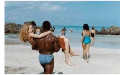
Где-то в Африке...

В дальнейшем секс-туризм приобрёл чёткое географическое разделение по половому признаку, а также стал источником лулзов для одних и стройматериалов для других.