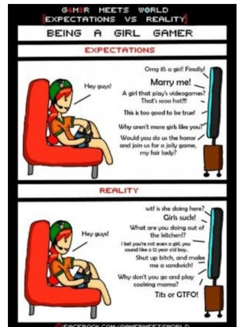
Иногда может и не сработать