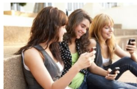
Синхронизация прошла успешно, все тян довольны.