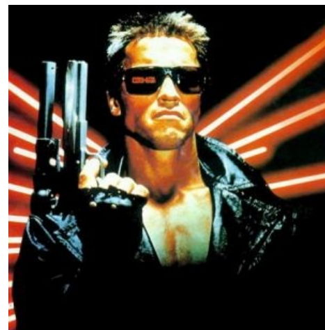
Типичный сервер скайнет (хотя скорее нод , или даже поинт ).