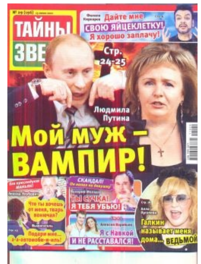
Сферическая жёлтая пресса России в вакууме