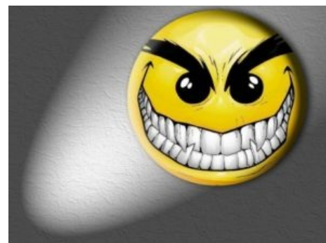
ДА, это он самый. Узнали?

Стоит заметить, что использовать смайлы по своему первоначальному предназначению — для выражения эмоций — никто не запрещает, но помните: все хорошо в меру.