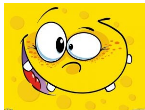
Классический вид анфаса типичного смайлофага.