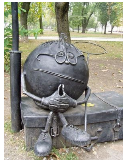
Памятник Колобку в Донецком парке кованных фигур.