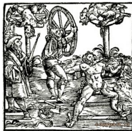
Массаж и здоровый сон

Кроме того, существовал иной метод. Осужденного фиксировали на земле, по стойке «смирно», лёжа на спине. В той стороне, куда были направлены ноги осужденного, располагался убердевайс, представляющий из себя столбик, вертикально вбитый в землю, на котором перпендикулярно располагался рычаг, двигавшийся вперед-назад и вправо-влево. На одном конце рычага располагалось тяжелое колесо, на другом — оператор аттракциона палач, перемещающий