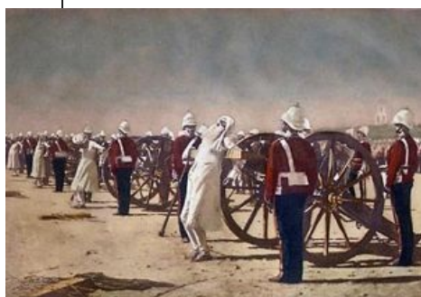
Та самая картина Верещагина

В Советском Союзе применялся выстрел в седьмой позвонок (это тот, который слегка выпирает на шее). Считается, что при повреждении спинного мозга в этой точке у организма отключаются все рефлексы, вследствие чего смерть мгновенна и безболезненна. Тело просто падает на землю с уже выключенным мозгом, без сердцебиения и дыхания, называется это «спинальный шок». Тот же метод предусмотрен и в современной России: из-за моратория не применяется, но в военное время может быть восстановлен. Расовые немцы в концлагерях подобрали другую точку приложения: стреляли в наиболее выступающую часть затылка, когда подрасстрельный на коленях с опущенной головой (или стоял с поднятой головой). Есть ещё рекомендации насчет выстрела в ямку под затылком. Оба способа гарантируют разрушение ствола мозга и массивное кровотечение. В Китае, например, исполнители жалуются на брызги крови, которые могут заразить их ВИЧ.