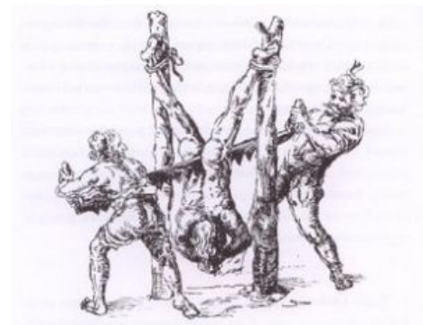
Распил через жопу

Древнеримская народная забава, но практиковалась и коллегами римлян по Древнему Миру. В Европах хорошо известно, хоть никогда широко и не применялось, так как сильно распиарено христианами. Последнее широкое применение — Япония, до Второй Мировой войны включительно, как правило, по отношению как раз таки к