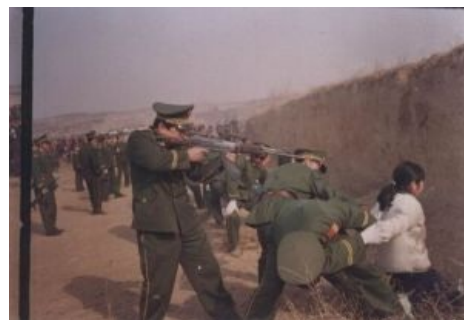
Китайцы как бы карают за вещества

Европейцу трудно понять ужас индийца высокой касты при необходимости только коснуться собрата низшей: он должен, чтобы не закрыть себе возможность спастись, омыться и приносить жертвы после этого без конца. Ужасно уж и то, что при современных порядках приходится, например, на железных дорогах сидеть локоть о локоть со всяким, — а тут может случиться, ни больше, ни меньше, что голова брамина о трех шнурах ляжет на вечный покой