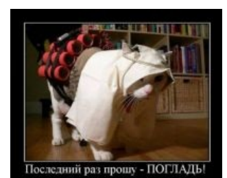
Погладь няшу, сука!!1

Каноничный пример использования своей смерти в качестве оружия — японские камикадзе . Как известно, такое встречается и у террористов , даже необязательно исламских, например одного из Ганди убила террористка, поднеся бомбу в букете цветов.