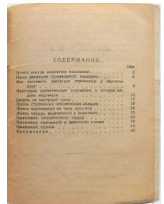
Пособие начинающим Франкенштейнам

А ещё ранее один итальяшка решил провести разряд тока через свежееубитую лягушку, которая ВНЕЗАПНО начала конвульсивно подёргиваться. ЧСХ, этот макаронник по имени Луиджи Гальвани подумал, что это могут быть и признаки избавления от железной хватки смерти и, возможно, мозг генерирует электричество для управления мышцами. Гальвани стал основоположником животного электричества. А вот его племяшка Альдини понял, что нужно срочно искать лысую обезьяну для проведения такого значимого эксперимента. Обезьяна была найдена в лице одного казнённого поциента, а результаты оказались всё теми же: лишь тушка задёргалась и гримаса покорчилась, застыв в ещё более ужасном положении. Фейл . Но! Насилование трупов электрическим током стало предпосылкой к появлению одной обожаемой реанимационными бригадами и их поциентами вундервафли — дефибриллятора.