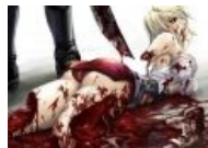
Вроде, дышит ещё, но это ненадолго