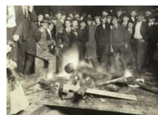
Улыбаемся и машем,