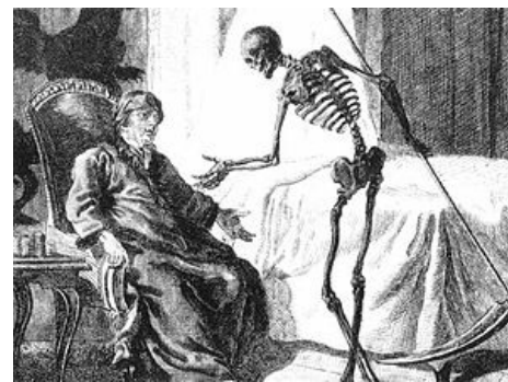
Please stand up