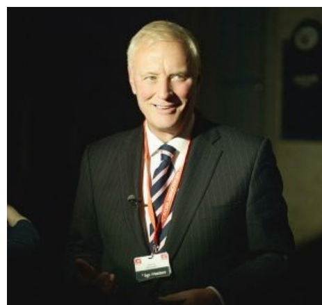
Барри Хирн — своими невьёбенными гонорарами снукеристы обязаны ему

Главными продвигателями и нагибателями стали Барри Хирн и Джейсон Фергюсон, истинные британцы, но по повадкам — чистейшие ЕРЖ. Новые руководители просекли, что профит имеет тот, кто получит место в зомбоящике , и подписали контракт на показ турниров по телеку, выбрав спонсорами несколько табачных компаний. ВНЕЗАПНО игра всем пришлось по нраву. Небыдло фапало на сложность комбинаций, духовно богатые девы шликали на постоянно мелькавшие в кадре задницы снукеристов, обыватели спорили «мой Хендри твоего О’Салливана сегодня порвёт». Дальше снукером увлеклись кетайтсы, которые бабла не жалели, а когда французы запилили канал «Евроспорт», снукерные боссы первыми окучили эту ниву. Когда лягушатники открыли рот на тему того, что родной канал показывает вражескую игру, руководители канала ответили — « норот желает смотреть, как шар влетает в лузу. В карамболе луз нет, влетать нечему, смотреть скучно, а потому звиняйте, может, в другой раз ».