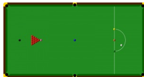
Начальная позиция в снукере

В отличие от многих видов бильярда, зародившихся ещё при царе Горохе, снукера 150 лет назад ещё не существовало в природе. А создал её в нынешнем виде Невилл Чемберлен — полковник Британской армии, садист, бабник, специалист по флюордросу и просто няшка. Получив некоторую дозу живительного свинца от афганских отморозков , бравый вояка был отправлен залечивать раны в Индию. Для такого человека это было явно скучно, и от нечего делать он стал регулярно гонять шары (нет, школьник, не в том смысле ). В итоге родился тот самый снукер. Впрочем, Чемберлен тогда отнёсся к своему изобретению спокойно — гораздо больше его в то время привлекала обильная раздача пиздюлей непокорным ирландцам. Лишь уйдя на покой, он, обнаружив, что англосаксы играют в кагбэ им придуманный вид бильярда, накатал маляву, в которой объявил себя единственным создателем снукера. В то время ему было уже хорошо за 80, и есть мнение , что нихуя он не создавал, а письмо было попыткой самопиара с целью вернуть интерес к дохляму стареющему герою. Как бы то ни было, своего он добился — во всех справочниках основателем игры считается он.