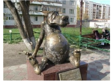
Памятник Волку в Томске

Режиссёр, к слову, Эдуард Назаров. Последующие его мультфильмы «Путешествие муравья», «Про Сидорова Вову» и «Мартышко» доставляют не меньше.