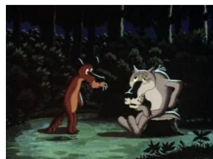
Пёс и Волк