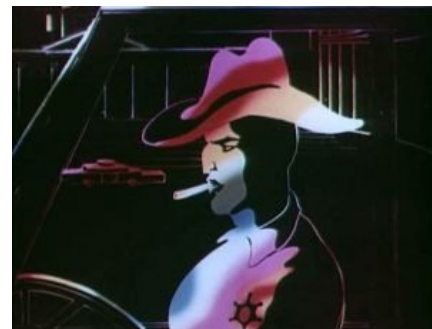
Все главные герои срисованы с реальных актёров

Алсо, все главные герои срисованы с реальных зарубежных и советских актёров 60-х — 70-х годов.