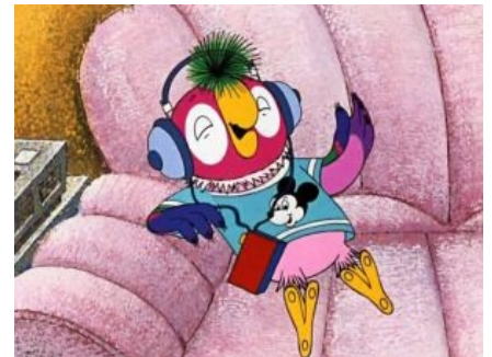
Попугай Кеша слушает Модерны Токинаги [2]