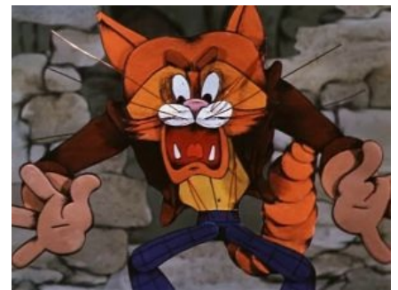
Леопольд проснулся в плохом настроении

Не менее винрарными были мультики, придуманные одним из соавторов «Ну, погоди», известным писателем-сатириком А. Хайтом про кота-добряка по имени Леопольд и двух гоповатого вида мышат, постоянно строящих ему козни. Многие фразы из мультя стали крылатыми , наиболее известные — « Ребята, давайте жить дружно! » и «Леопольд, выходи, подлый трус!». Первый советский няшный мультик — мыши таки произносят «ня» в «Дне рождения КЛ». Кроме того, там встречается запоминающееся вещество «Озверин» и вариант Incredible Machine , невозбранно спизженный из одной из серий «Тома и Джерри» — как, впрочем, и весь сюжет, только вывернутый наизнанку. Сериал выглядит халтуркой, которая заняла своё место в пантеоне не благодаря своему качеству, а благодаря популярности у детишек, которым остро не хватало живительного экранного мочилова в любом виде.