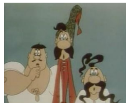
What The Fuck?!