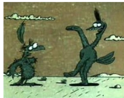
Страус и гриф

Психоделическая история о попытке грифа научить страуса летать (рисовал вышеупомянутый Татарский). Заканчивается всё как обычно . Широко знаменита фраза из него — «Ноги, крылья... Главное — хвост! ». Менее известны: