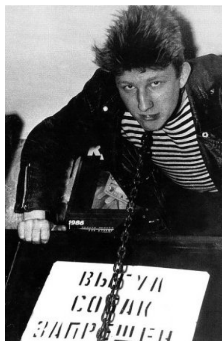
Сферический совок-панк в вакууме

Погиб советский панк ровно так же, как и советский рок — с распадом Совка: