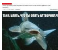
Стать его девушкой