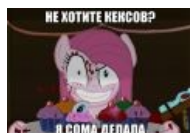
Делала сома, а получились кексики