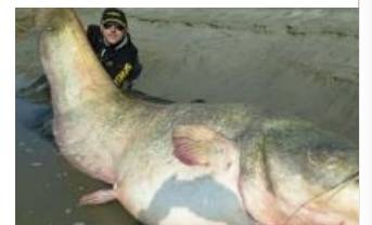
Сом из Армии Крайовой...