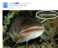
Скачать ему игру