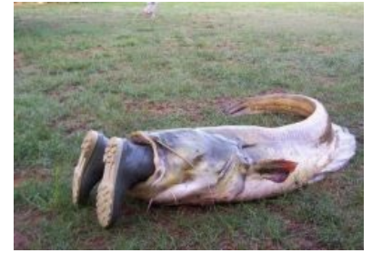
В рот мне ноги!

Ходят легенды про сомов-мутантов из пруда-охладителя в Чернобыле . Но это всего лишь легенды , которые раздуваются сталкерами , таскающими туристов в Зону. Сомы как сомы, средних размеров, с одной