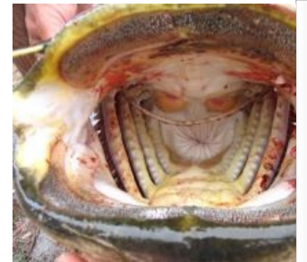
Таким хлебалом да медку бы хапнуть...