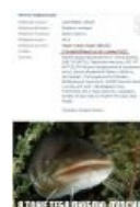
Пацан, влюбленный в сома