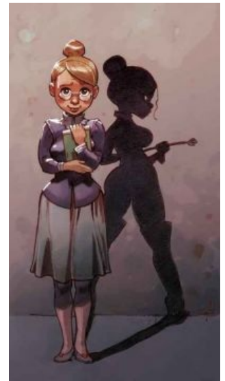
Спермотоксикоз сильно искажает картину восприятия мира