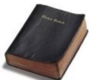
Jesus dies on pg. 681