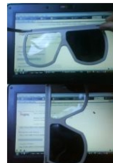
Поляризационные очки из IMAX'a.

В кинотеатрах IMAX (равно как и в правильных олдфажских советских стереокинотеатрах) все тоже довольно просто: оба кадра проецируются на экран одновременно через повёрнутые на 90° относительно друг друга поляризаторы . Зрителям, соответственно, раздают одноимённо поляризованные очки. Суть эффекта в том, что каждый глаз зрителя в результате видит только свою картинку. Помимо очков, хитрость ещё и в экране: далеко не всякая поверхность сохраняет поляризацию света при отражении. Кроме линейной может использоваться правая и левая круговая поляризация — такой метод хорош тем, что позволяет свободно вертеть головой, тогда как в имаксе при отклонении головы от вертикали картинка начинает двоиться. Также применяется в некоторых стереомониторах, стереотелевизорах и ноутбуках: на экран наклеивается пленка, в которой чересстрочно меняется поляризация. Недостаток — вдвое уменьшается разрешение по вертикали. Можно поставить школьный эксперимент: возьмите две пары таких очков и наложите два фильтра (очка) друг на друга. При взаимном повороте на 90° прозрачность резко исчезнет (можно обойтись одними очками и ЖК-экраном, например, мобильного). Ещё один забавный эффект можно получить, если развернуть очки на 180° (в смысле, дужками вперёд): картинка останется объёмной, но объём как бы вывернется наизнанку. Осторожно, впечатлительные могут блевануть.