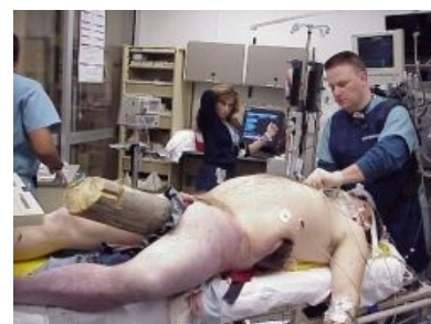
Стержень в природе

Стержень — виртуальный орган, служащий источником неестественного характера и силы человека. Иногда ассоциируется с позвоночником , но чаще — с Мужским Половым Хуем , причём не только с собственным, но и вставленным извне, так чтоб голова не качалась. В реальности, как и отмечено — виртуален, ага.