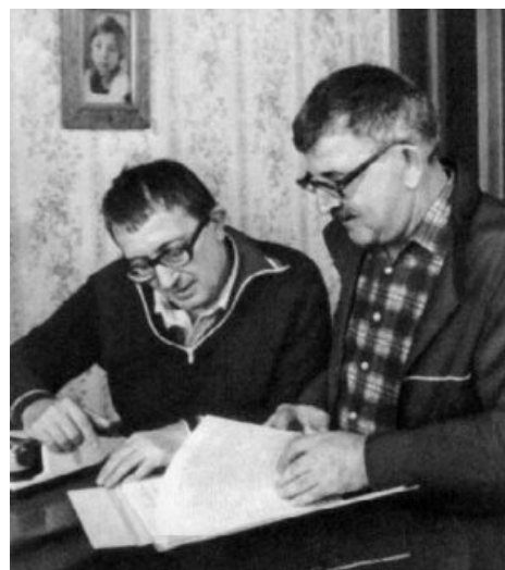
В поте лица...

АБС ненатурно доставили всем слоям целевой аудитории — у них в багаже и танчики , и рыцари , и смехуёчки с переходом в кухонную антисоветчину , и покорение природы на отдельно взятых планетах в духе бессмысленного и беспощадного соцреализма, и космос высшей пробы , и настоящий сверхъестественный ужас по полной программе , и полная Кафка , и целых три кубометра неистовой интеллигентской рефлексии, и « советский производственный роман », и детектив с загадочными убийствами в стиле Агаты Кристи, и даже виртуальная реальность для опытов над живтоне .