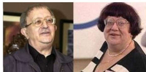
Себя как в зеркале я вижу...

Много ли военных мифов в Швейцарии — стране, на протяжении веков поставлявшей всей Европе профессиональных военных, ландскнехтов?