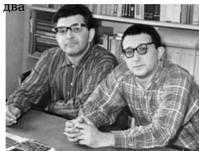
Типичные советские интеллигенты

Аркадий умер в 1991 году, а Борис его догнал только в 2012, до последнего вздоха рецензируя и воспитывая молодых пейзаелей (в рамках своего питерского литературного семинара, из которого ещё в советское время вышла куча как приличных авторов, так и лиц с весьма опухшими гондурасами ), издавая журнал новой фантастики «Полдень. XXI век», а также вёл off-line интервью с читателями на rusf.ru . Опосля смерти брата таки сподобился написать две книги соло. Обе пронизаны депрессией и чёрным юмором, иногда служат поводом для холиваров. Однако ж предсмертный роман Аркадия по депрессуре не уступает.