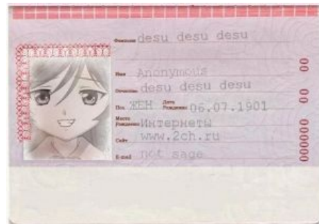
Скан паспорта Суисейсеки

RULE # 41 IT NEEDS MORE DESU. NO EXCEPTIONS.