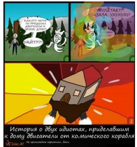
Гений и после смерти гений