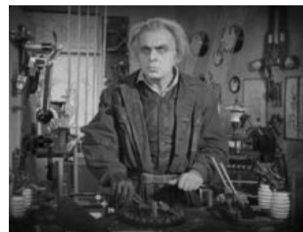
Сумрачный германский гений готовится включить рубильник

Характерное место обитания — Германия (ибо полностью фраза звучит как «сумрачный тевтонский гений») и около, что обусловлено национальными немецкими особенностями: любовью к планированию и тщательной проработке деталей при полном отсутствии способностей ко взгляду на проблему целиком, ибо это — задача исключительно уполномоченного фюрера. И если фюрер оказывается без башни, то все немцы, тщательно и