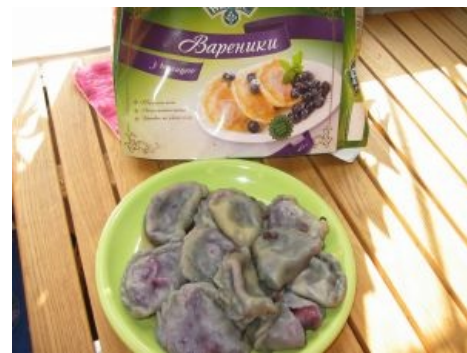
Нямка ужасов — антисуши

обучения у них сводится к следующему: посмотри на готовое и повтори, а как — твои половые трудности. Именно поэтому японцы готовят своих мастеров не 3-4 месяца на всяких курсах при суши-барах, а 6 лет.