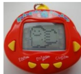
Dinokun — конкурент Apollo.

Apollo — наиболее популярный в 90-е китайский Тамагочи