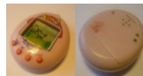
Apollo — наиболее популярный в 90-е китайский Тамагочи

На самом пике популярности этих девайсов среди школьников считалось понтом иметь как можно больше и круче тамагочи; крутость тамагочи оценивалась количеством кнопок: трёхкнопочные считались самыми лоховскими ( ЧСХ , оригинальный японский девайс фирмы «Бандай» был и остаётся именно таким), а девайс с пятью и