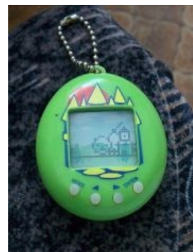
Ещё вариант Apollo