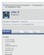
Типичный профиль модератора