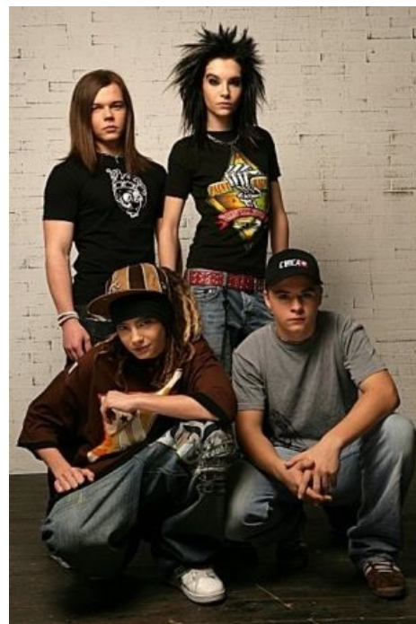
Билли, покажи сиськи.

Ненавидеть ТХ — так уж ненавидеть по полной, и на форумах нередко можно встретить посты, обличающие их музыку как чудовищное, кровоточащее, леденящее душу говно. На самом деле, основная причина говняности группы — внешность и навязчивость. Что касается собственно музыки, то чья бы мычала, а не эта страна, породившая такого же псевдороба — Звери [1] , Ранетки , Братья Грим — в куда большем количестве и худшем качестве. Впрочем, «талантливостью» и «оригинальностью» здесь действительно не пахнет, а наличие чего-то ещё хуже никак не делает сабж лучше: