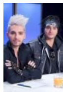
Два брата-акробата смотрят на тебя внимательно