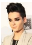
В стиле Адама Ламберта