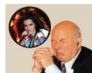
Старик Батури не хочет.