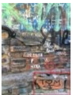
2008: Аааа, сволочи!

Самое смешное, что незадолго до этого вандалы из Art Destroy Project действительно закрасили стену Цоя чёрной краской. Но всем было безразлично .