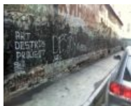
2006: всем похуй