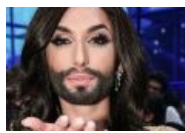
Билли, не коспли меня!