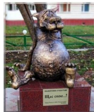
Ещё один памятник. Чему бы вы думали?