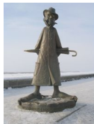
Томский Чехов такой томский