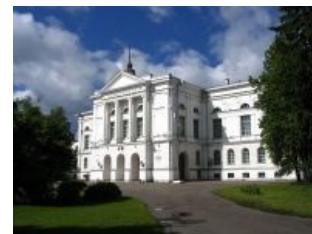
Тот самый университет

Томск ( Таёжное Отдалённое Место Ссылки Каторжников, Сибирские Афины, Умный Город, Наногород, Фомск, Томчанск, Ушайск ) — город, в котором появился первый в Сибири университет, после чего больше ничего не появилось, кроме первого за Уралом технического университета. Так и остался с университетами, over 100500 студентов на пицот тыщ населения и ощущением интеллектуального превосходства . Более всего томичи ненавидят Новосибирск , город-нуб, возникший, по сути, 80 лет назад и ВНЕЗАПНО ставший более крупным городом, чем Томск.