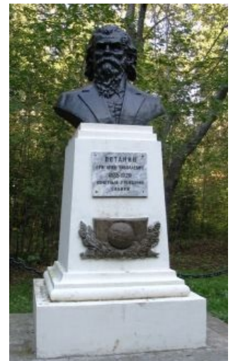
Памятник Г. Н. Потанину