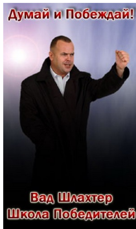
Тренинг «Как поиметь весь мир» как бы намекает