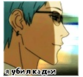
Он убил Кадзи.